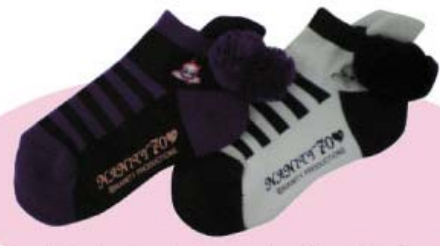
ブラック×パープル ホワイト×ブラック