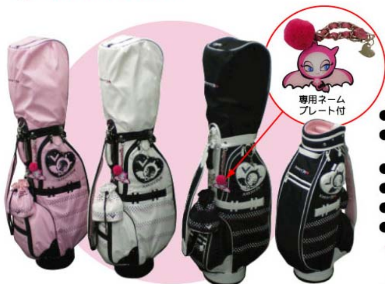
●ピンク ○オフホワイト ●ブラック