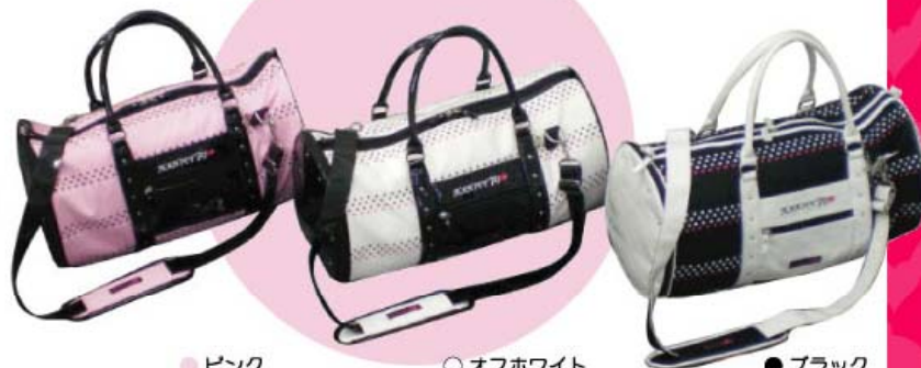
●ピンク ○オフホワイト ●ブラック