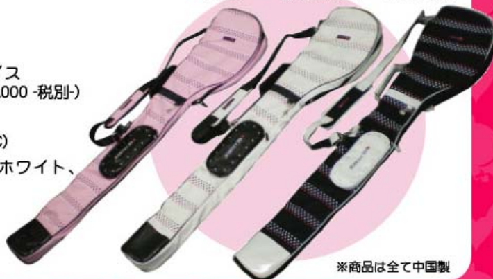
※商品は全て中国製

※商品改良の為、予告なく商品仕様を変更する場合があります。 ※印刷物の為、実物と多少異なる場合があります。