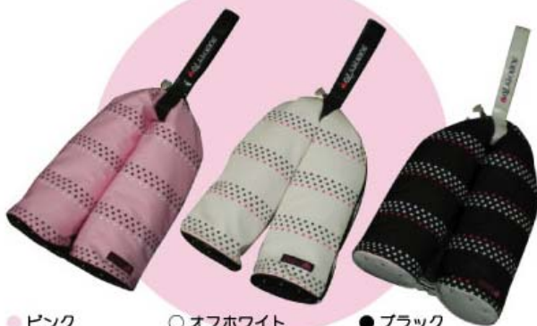
●ピンク ○オフホワイト ●ブラック