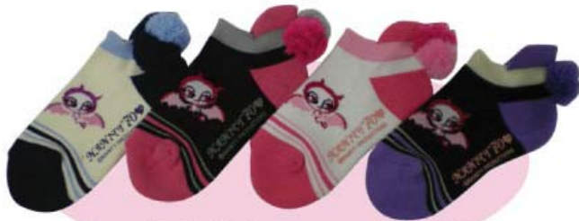
アイボリー×ネイビー ホワイト×ピンク ブラック×ピンク ブラック×パープル